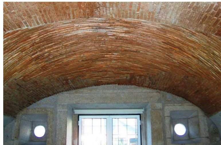
01 Aproveitamento do teto da capela do Real Hospital Militar S. João de Deus.

drid em 1886. S. João de Deus é proclamado, juntamente com S. Camilo de Lélis, patrono dos doentes e seus hospitais. A 8 de Março é o dia de S. João de Deus. Foi beatificado em 1630 e canonizado em 1660.