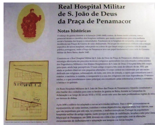
02 Placa comemorativa da requalificação do edifício.